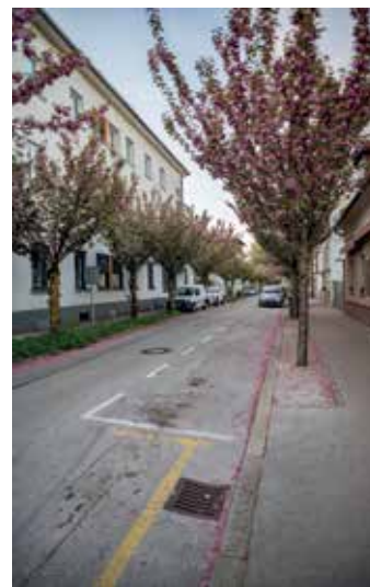
2023: drevored japonskih češenj na Aljaževi ulici