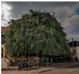
2020: povešava bukev, ki stoji na vrtu pred hišo na Vodnikovi cesti 93