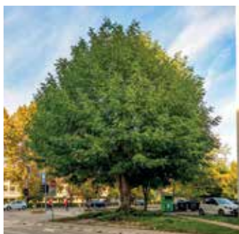
2021: kavkaški krilati oreškar na vogalu Linhartove, Knobleharjeve in Fabianijeve ulice

V okviru skrbi za mestno drevje smo v Ljubljani v zadnjih letih že štirikrat izbrali drevo leta in enkrat drevored leta. Letos izbiramo oboje. MOL tudi tokrat meščanke in meščane vabi, da sporočijo, katero drevo in drevored si po njihovem mnenju zaslužita ta naziv.