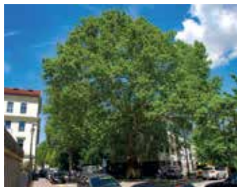
2019: mogočna platana na vogalu Streliške in Strossmayerjeve ulice, eno izmed najstarejših dreves v mestu