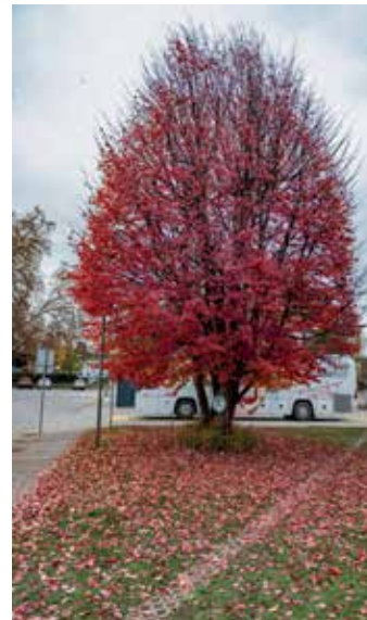
2022: perzijska bukev, ki raste na zelenici pri Zavodu Republike Slovenije za transfuzijsko medicino na Šlajmerjevi ulici

Zmagovalna drevo in drevored bosta znana 22. aprila 2025, na svetovni dan Zemlje, ob zaključku akcije Za lepšo Ljubljano.