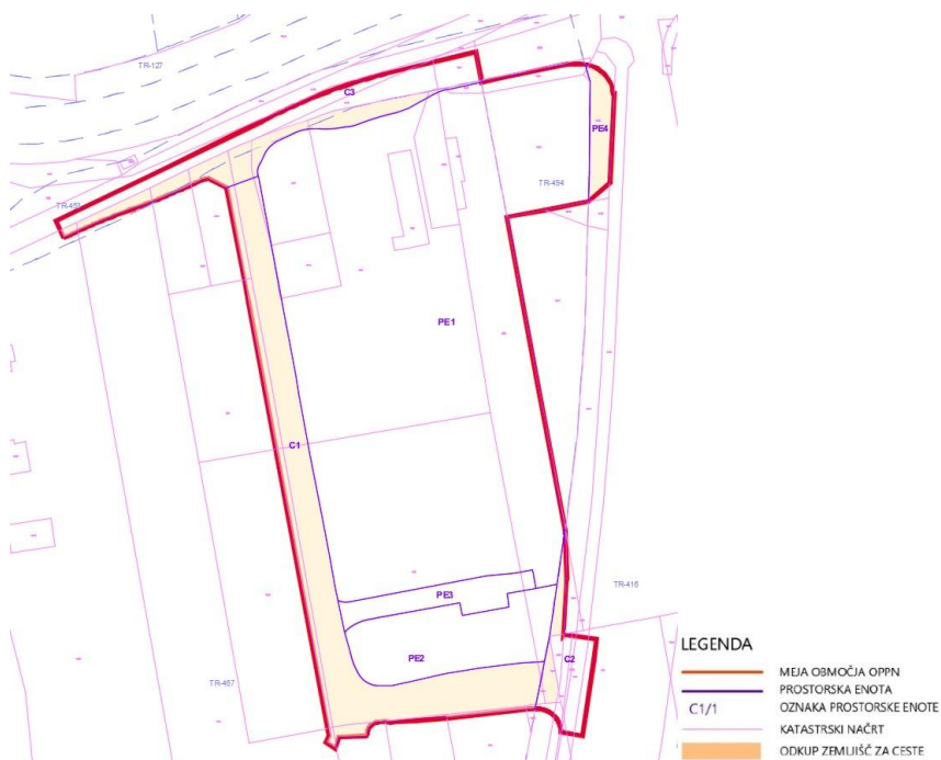
Slika 2: Zemljišča, ki jih mora MOL odkupiti za ureditev javnih cest v prostorskih enotah C1, C2 in C3