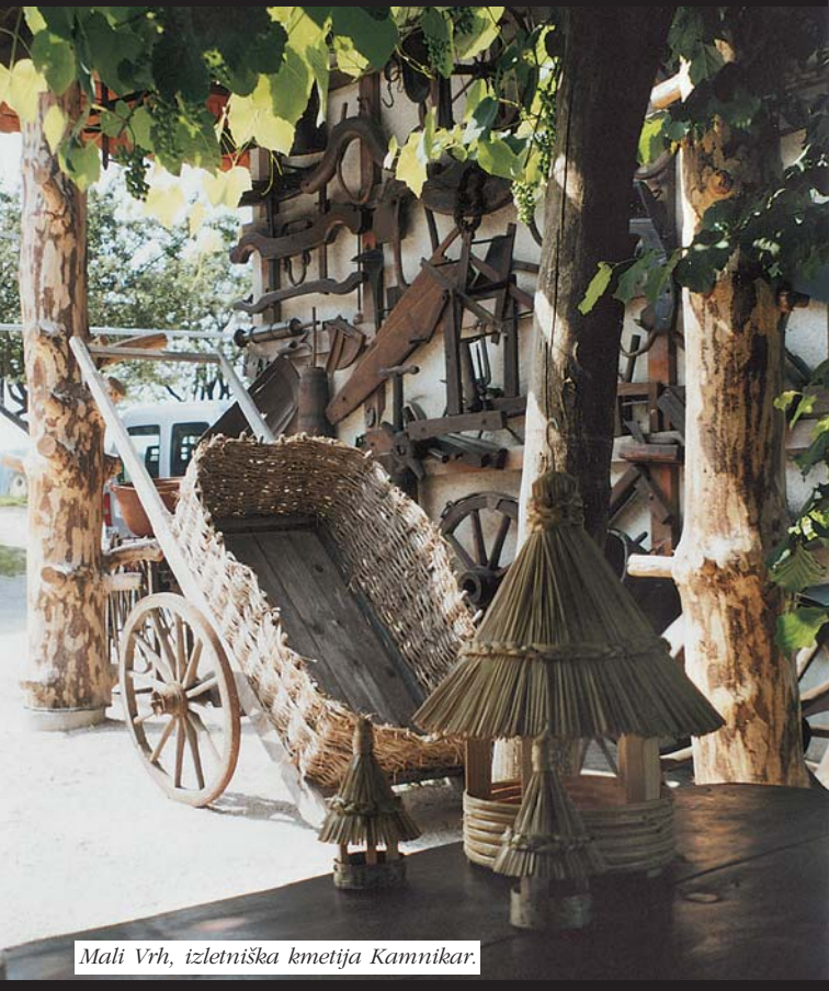
Mali Vrh, izletniška kmetija Kamnikar.

Nekdaj je bila večina kmetij samooskrbna, kar pomeni, da so vse, kar so potrebovali, naredili, pridelali in predelali doma. Zaradi takšnega načina življenja so se na podeželju razvile in uveljavile številne oblike obrti in dejavnosti. Večina le-teh (polaganje slamnatih streh, mizarstvo, čevljarstvo, mlinarstvo, kovaštvo, oglarstvo, drvarjenje, platnarstvo oz. tkalstvo (tkanje lanu) in