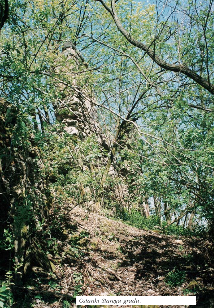
Ostanki Starega gradu.

Pomembnejši pečat temu območju dajejo tudi kapelice ob poteh, za njihovo postavitvijo se skrivajo priprošnje in usode posameznikov. Vedno so bile postavljene kot spomin na neke dogodke, priprošnjo za srečno vrnitev iz vojne, ozdravitev ali srečo pri živini.