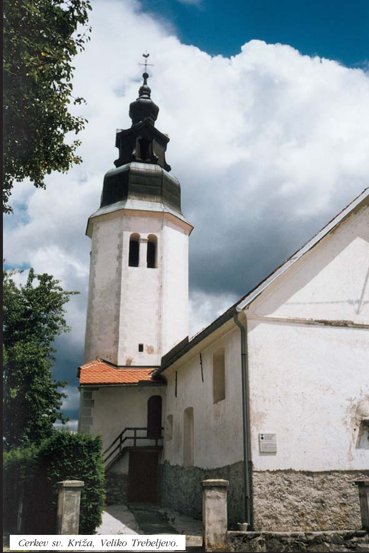
Cerkev sv. Križa, Veliko Trebeljevo.