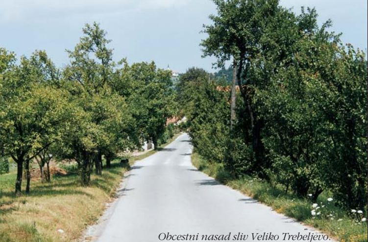
Obcestni nasad sliv Veliko Trebeljevo.

Vzhodno hribovito območje Mestne občine Ljubljana spada v Predalpsko hribovje ter predstavlja začetek Posavskega hribovja. To je hribovit in težko prehodni svet podolžnih slemen in globoko zarezanih dolin.