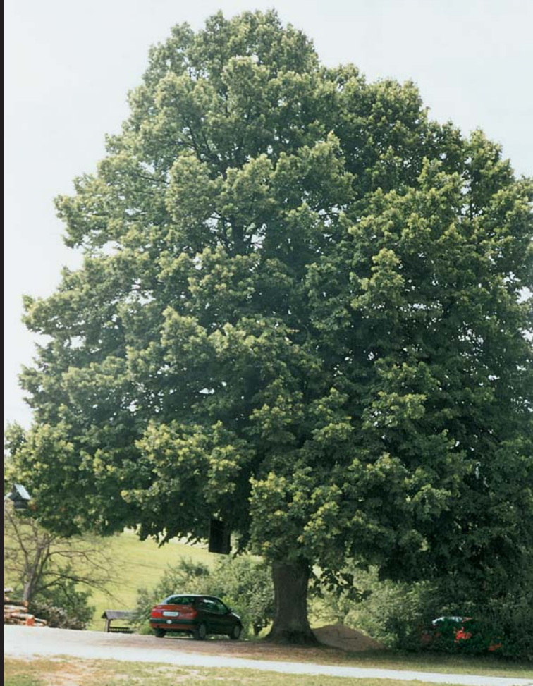
Lipa v Štangi.

Stara mogočna drevesa dajejo poseben pečat celotnemu območju. Mogočni divji kostanj pred cerkvijo sv. Marjete na Prežganju, v Podlipoglavu, lipe na Javoru ter na Malem Lipoglavu (pri šoli, cerkvi, gostilni ter pri gasilskem domu), macesen na Javoru (pod cerkvijo), drevored orehov ob cesti na Brezje.