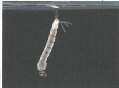
Ličinka tigrastega komarja v vodi.