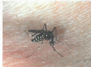
Tigrasti komar je žuželka s popolno preobrazbo (jajčece, ličinka, buba, odrasli), ki za svoj razvoj potrebuje vodo.