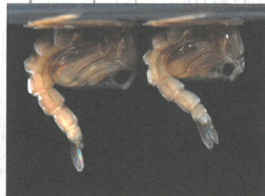
Bubi tigrastega komarja v vodi.