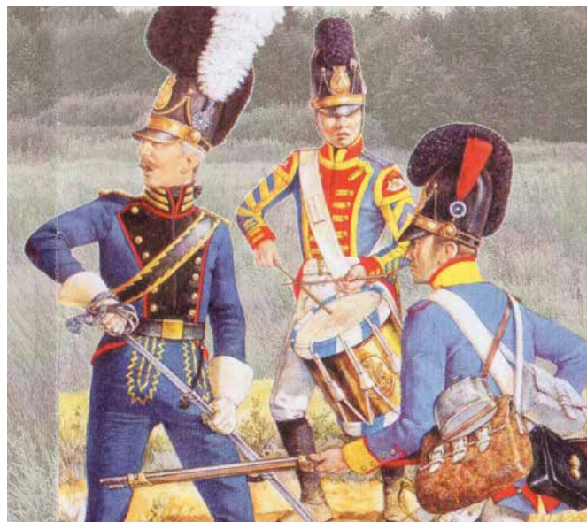
Vojaška oblačila pehote v letih 1798–1815.

Francozi so za čas Ilirskih provinc za Slovence storili marsikaj dobrega, čeprav jih domačini niso marali. Uvedli so enakost pred zakonom in splošno vojaško obveznost za vse državljane, poenotili so davčni sistem in odpravili davčne privilegije. Cerkvi so odvzeli posvetne zadeve, zato je moral župan upravljati z uradnimi knjigami. Vpeljana je bila civilna poroka. Francozi so poddržavili sodstvo, zemljiškim gospodom so bile odvzete vse javne funkcije, vpeljali so sodobno upravo in v celoti modernizirali šolstvo. Med prebivalci se je začelo širiti razsvetljenstvo. Kmet je postal enakopraven državljan. Odpravljena je bila tlaka. Zemljiška gosposka je izgubila upravne in sodne pravice, ostala jim je zemlja v upravljanju. Spremembe so se dogajale tudi na področju šolstva. Cerkvi je bil odvzet nadzor nad šolstvom. Francozi so bili prepričani, da Slovenci, Hrvatje, Srbi in na tem ozemlju živeči Nemci in Italijani govorijo ilirsko. Pri